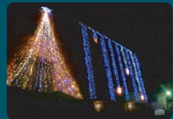
東住吉キリスト集会のイルミネーション (12月25日まで毎晩 PM5:00~AM0:00 点灯)

入場無料 献金はございません 但し、親子チャリティークリスマス会のみ 小学生以上の方は参加費1人100円必要です